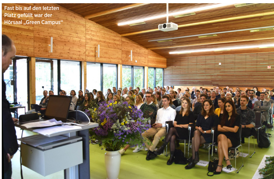
Fast bis auf den letzten Platz gefüllt war der Hörsaal „Green Campus“