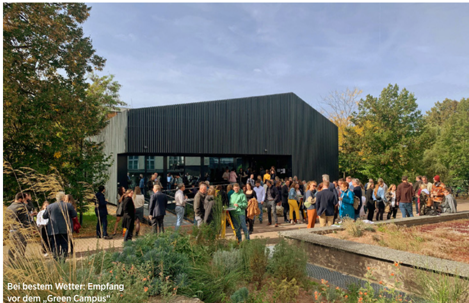
Bei bestem Wetter: Empfang vor dem „Green Campus“

Feierliche Verabschiedung der Studierenden der Fachrichtungen Landschaftsarchitektur und Erneuerbare-Energien-Management an der Fachhochschule Erfurt