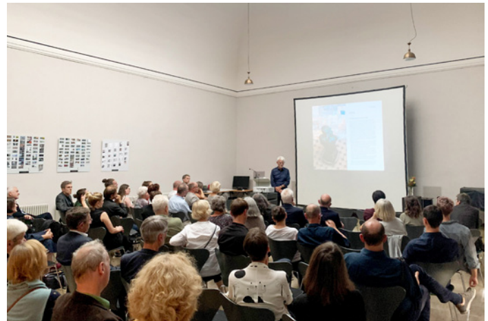
Vorstellung des Buches „Ein Weg zur Architektur“ im Oberlichtsaal